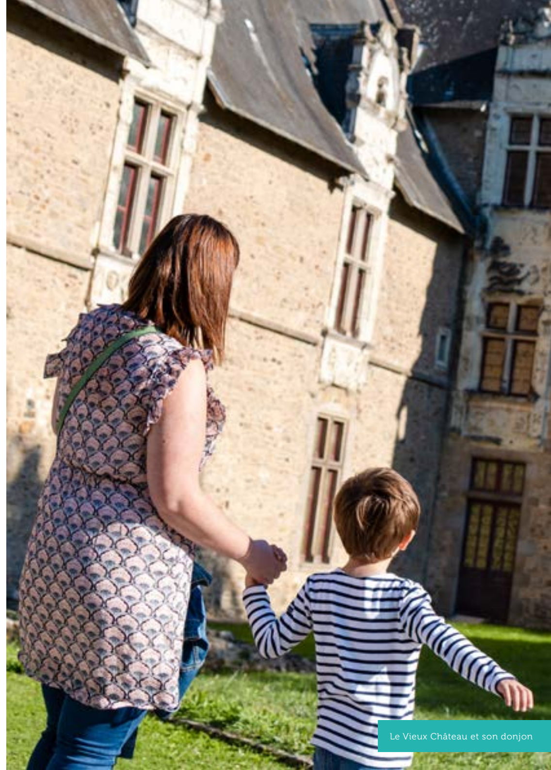
Le Vieux Château et son donjon