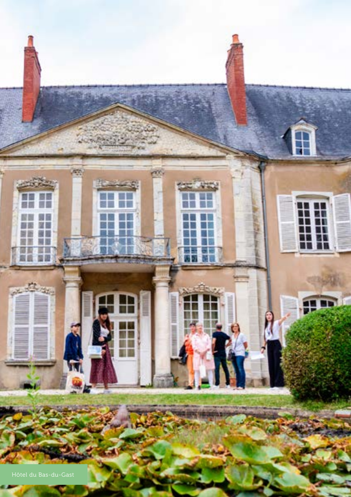
Hôtel du Bas-du-Gast