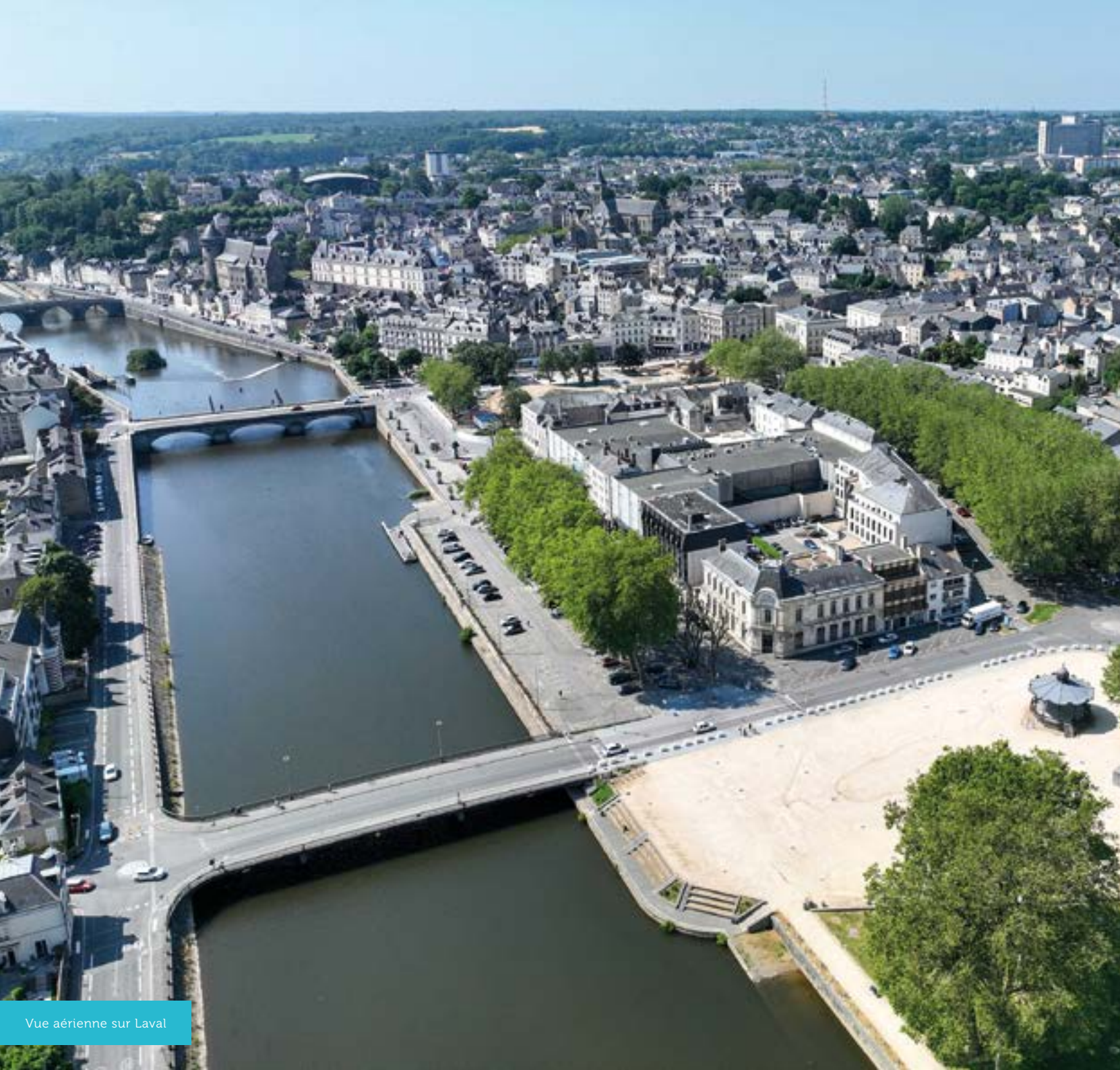
Vue aérienne sur Laval