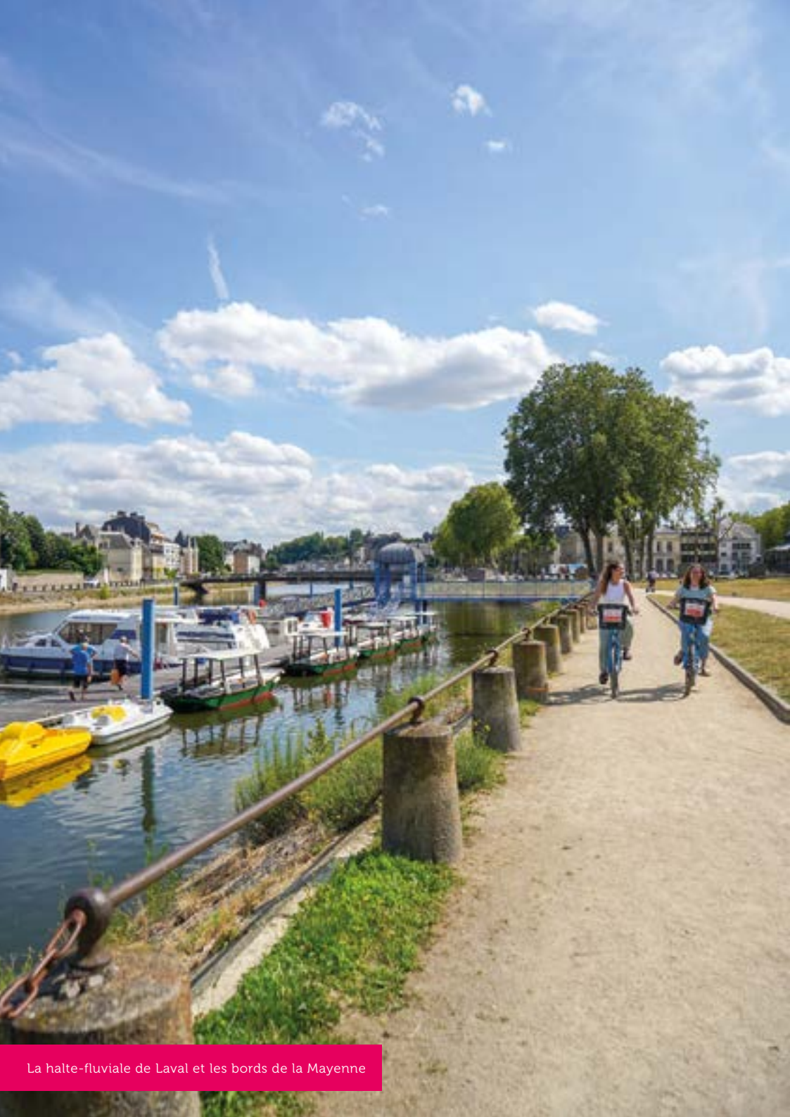
La halte-fluviale de Laval et les bords de la Mayenne